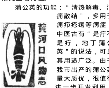
本版责任编辑 张金康

蒲公英的功能：“清热解毒、消痈散结”，多用于痈疔疮疡等病症，中医古有“是疔不是疔，地丁蒲公英”的说法，可见其用途广泛。由于我市出产的蒲公英量大质优，很值得进一步开发利用。