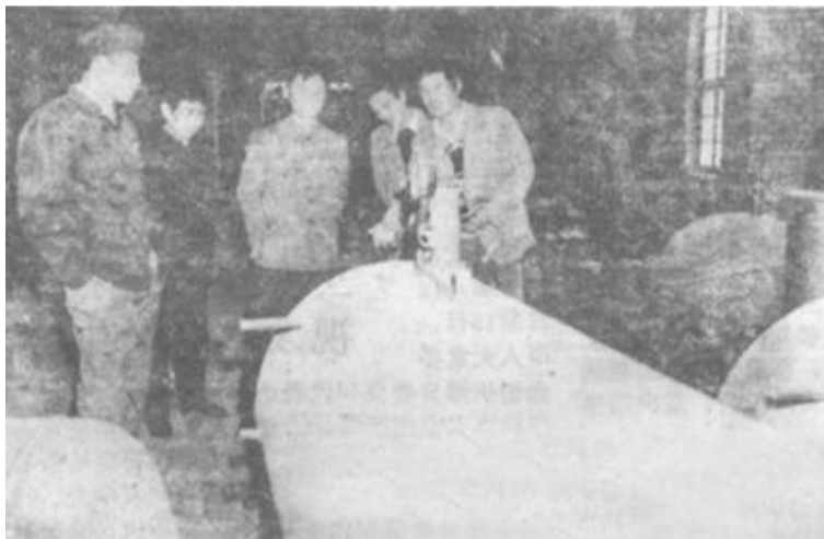
垦利石油机械厂在县农行的支持下，三年迈出三大步，去年获产值430多万元，盈利28万元。图为农行领导在该厂了解生产情况。

和可能，盲目追求高层次消费，认为人能我大于收，超前消费，有的甚至债台高筑。为此，统计部门呼吁要加强正确引导，合理安排衣食住行用，量入为出，勤俭持家，使经费投向合理，消费结构科学。（盖乃武）